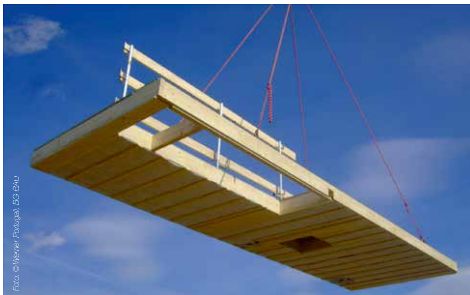
Abb. 4: Ein bereits am Boden angebrachter Seitenschutz steht sofort nach Verlegung des Deckenelements zur Verfügung und verhindert zuverlässig einen Absturz durch das Treppenloch.

det werden. Die Abstützungen müssen dabei voll ausgefahren sein. Der Kranführer schaltet dann an der kabelgebundenen Fernbedienung auf den Personensicherungsmodus um. Anschließend ist die Geschwindigkeit der Kranbewegungen aus Sicherheitsgründen stark gemindert. Das wie ein Automatikgurt im Auto funktionierende Höhensicherungsgerät (HSG) ermöglicht dem gesicherten Zimmerer eine große Bewegungsfreiheit. Es muss doppelt angeschlagen werden: einmal am Kranhaken und einmal an der Flasche.