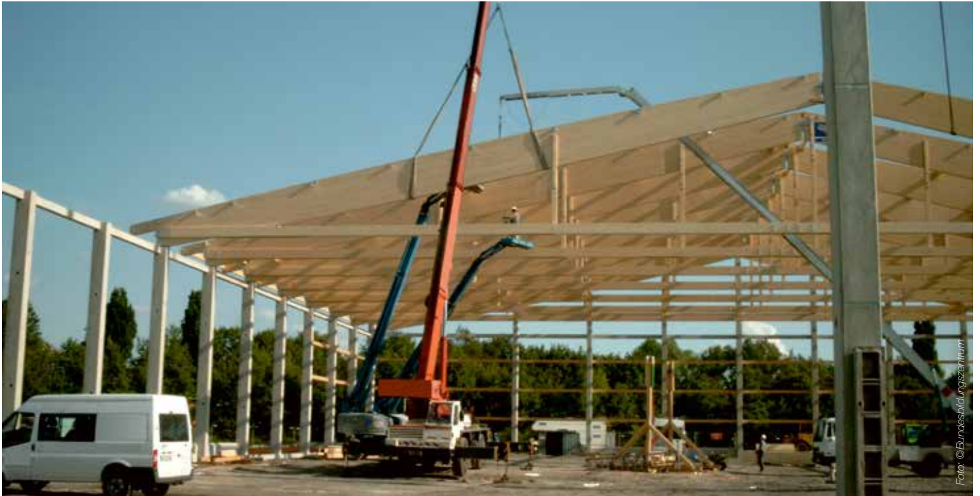
Abb. 1: Ob auf Großbaustellen oder beim kleinen Reparaturauftrag: Wir Zimmerer arbeiten oft in Bereichen mit Absturzgefahr. Damit wir oben bleiben, achten wir auf Sicherheit. Um noch besser zu werden, hinterfragen wir eingefahrene Routinen und prüfen gewohnte Arbeitsmittel. Vieles lässt sich optimieren!