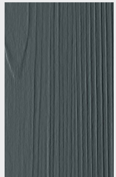
Anthrazitgrau, Holzstruktur Art-Nr 5422121