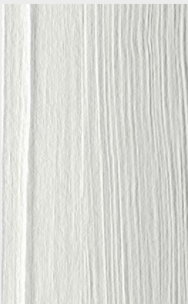
Schneeweiß, Holzstruktur Art-Nr 5672121