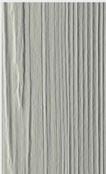
Nebelgrau, Holzstruktur Art-Nr 5842121